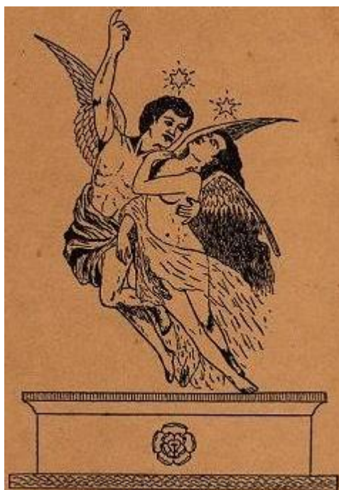
TIBONI ( PAVEJEAU )